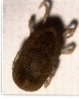
Меки кърлежи от род Ornithodoros

Кои животни могат да бъдат засегнати (гостоприемници)?