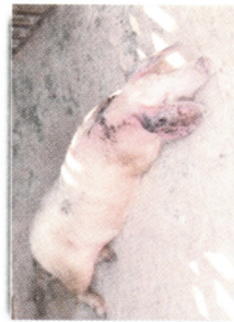
Намален апетит, цианоза и нарушена подвижност в рамките на 24-48 ч. преди настъпване на смъртта